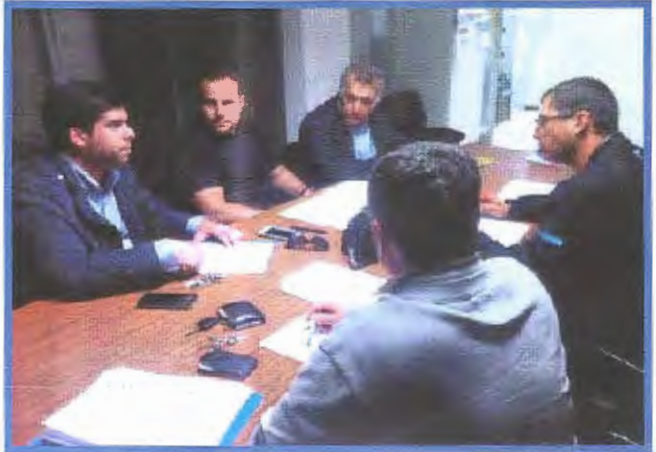
Reunión del servicio Jurídico y delegados de CC.OO.

Además nuestros abogados también han defendido de forma individual a compañeros en vía judicial, como en la vía administrativa.